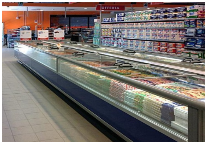
MINI TORONTO BT G4