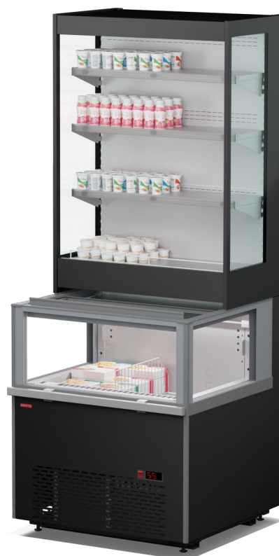
IRKUTSK 2 H195